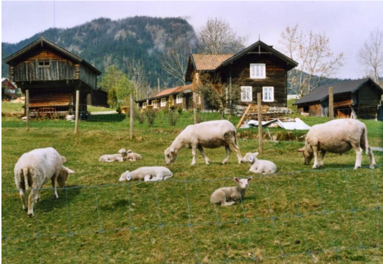
Figur 4. Sauer på beite på Sud-Hovland i Hjartdal. Sud-Hovland er ein gamal gjestgjevargard. Den ligg fint til i eit gamalmodig og samstundes levande kulturlandskap, med aktivt dyrehald både på eigen gard og på grannegardane.