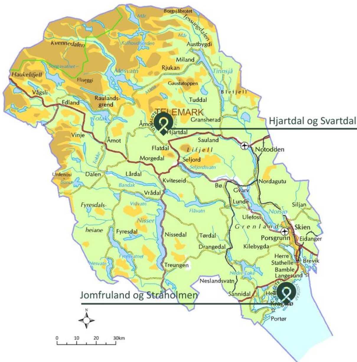
Figur 2. Hjartdal og Svartdal UKL ligg i Øvre Telemark, i Svortes dalføre. Ute ved kysten ligg det andre utvalde kulturlandskapet i Telemark per 2018, Jomfruland og Stråholmen UKL.