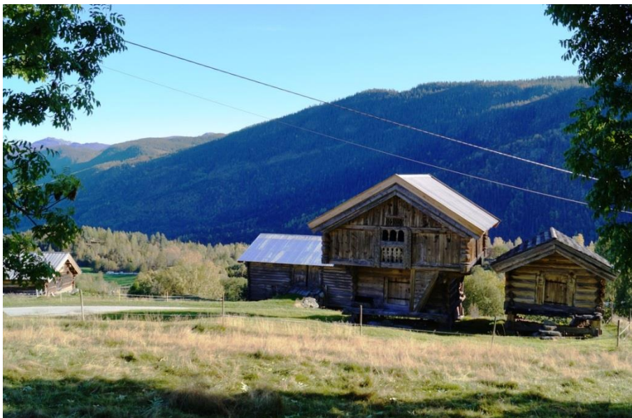
Figur 12. Loft og veslebur på Sud-Åbø, med fjøs og låve i bakgrunnen. Heile gardsanlegget på Sud-Åbø er freda. Med unntak av stall har tunet alle dei tradisjonelle bygningstypene. Vesleburet har kapiteldyr på beitskiene, og er gjennom segn knytt til stavkyrkja som blei riven i 1809. Åbø-bonden skal i si tid ha kosta bygginga av kyrkja.

Oversyn over freda bygningar er å finne i Riksantikvarens innsynsløysing www.kulturminnesok.no . I databasen Askeladden er i tillegg SEFRAK-registeret med alle bygningar eldre enn 1900 med. Dette er også å finne på kvar einskild eigedom på www.seeiendom.no . For Svartdal er vel og merke ikkje SEFRAK-registreringane digitalisert enno, men er å finne i papirutgåver.