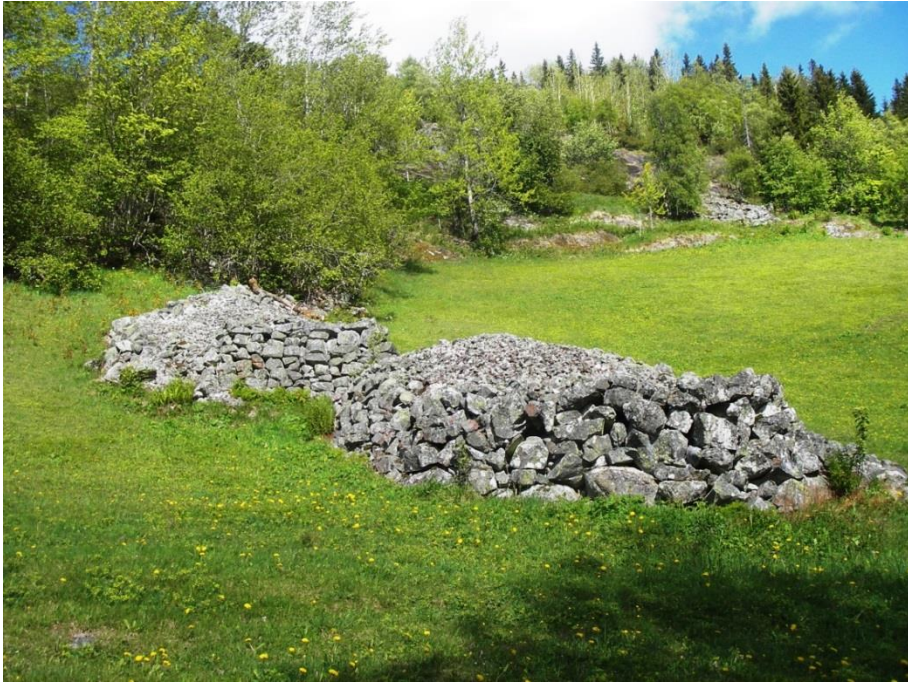
Figur 13. Nennsamt mura røyser på Sud-Barstad i Svartdal.