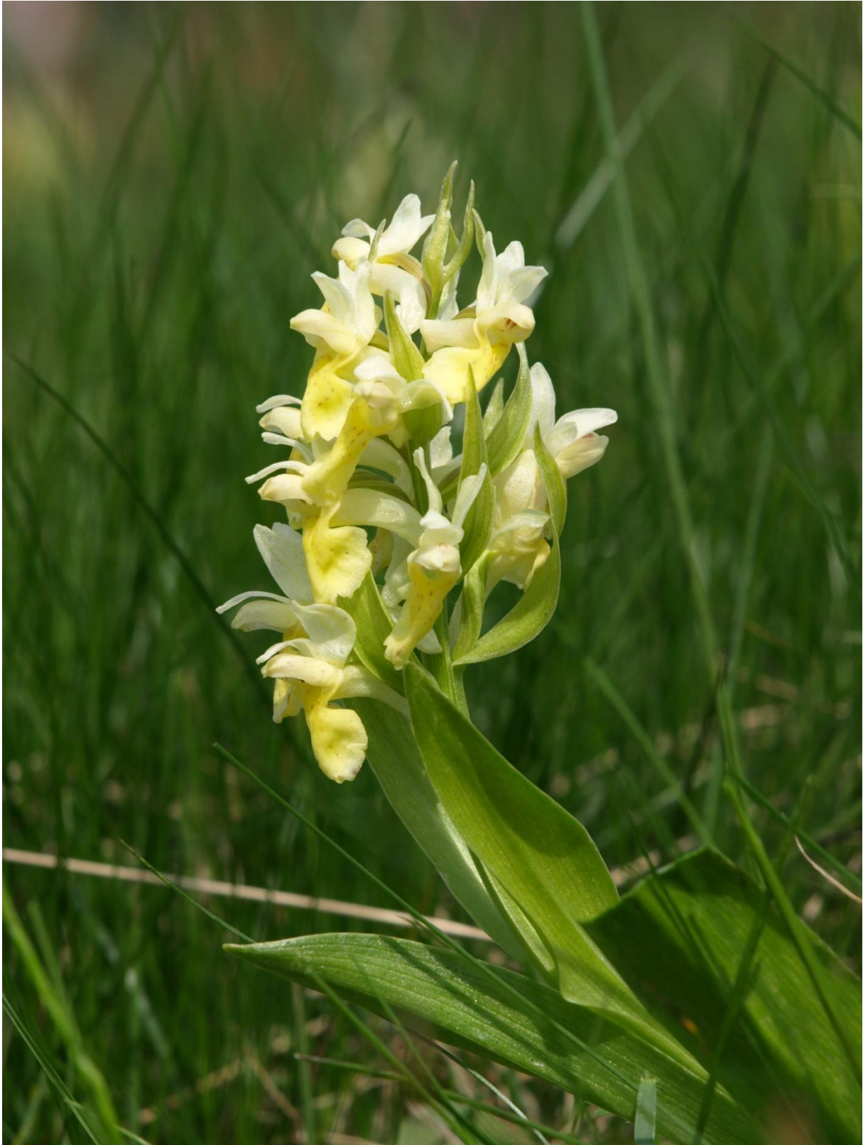
Figur 11: Systemarihand ( Dactylorhiza sambucina ) er ein sjeldan orkidé og Telemark sin fylkesblom. Blomen er avhengig av ugjødsla slåtteeengar og beitemark. Ikkje plukk blomen! Han er freda og må få stå i ro der han veks!