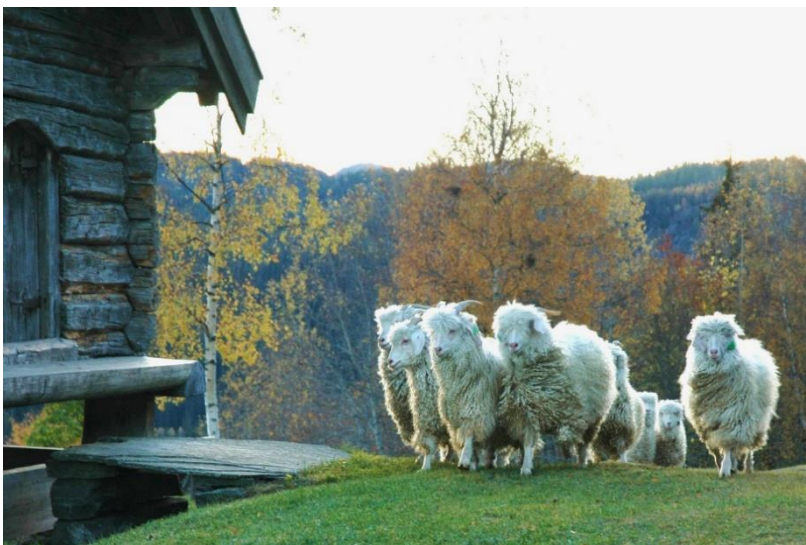
Figur 6: Mohairgeiter i tunet på Midt-Svartdal.