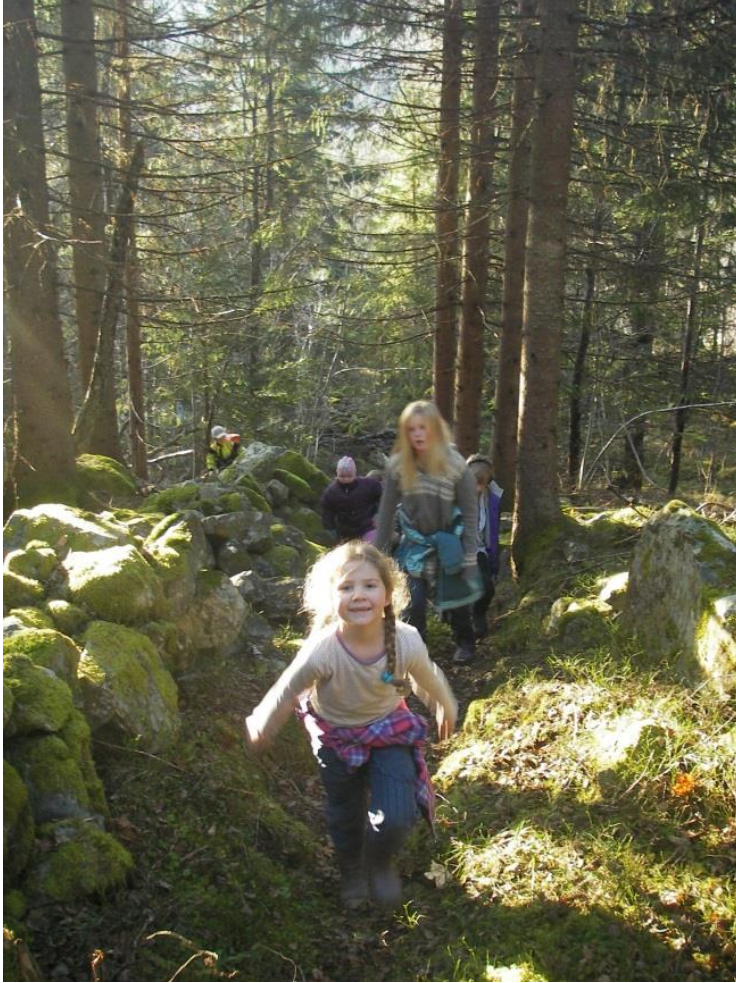
Figur 15. Skuleelevar på tur opp Grøpåstadgutu. Kulturlandskapsgruppa i Hjordal rydda og skilta denne i seinare tid. Den tida gutu kom på plass var det ikkje granskog her, men eit ope landskap med enger og åkerlappar i kring. Det er fleire tufter etter husmannsplassar langsetter denne buferdsvegen.