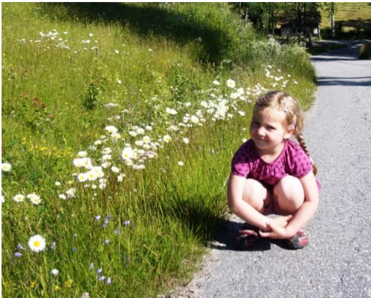
Figur 19. Fint å gå ein sommarmorgon langs Holmsvegen i Hjartdal, for liten og stor, innbyggjar og tilreisande.

Som det går fram av kap. 3.2 er det utfordringar knytt til å ta vare på dei meir kvardagslege innslaga av blomerike enger i landskapet, så som middels artsrike veg- og jordekantar. I denne samanhengen er det viktig å inspirere til innsats.