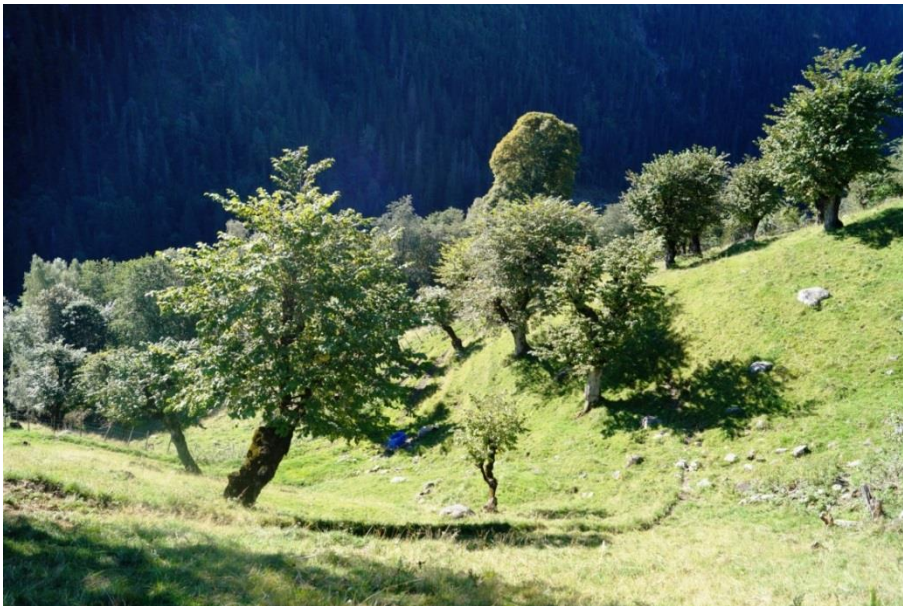
Figur 9. Styvingstre av alm i lauvingslia på Myljom-To i Hjartdal.

I Ambjørndalen er det to store naturtypelokalitetar knytt til skog. Langs heile nordsida av dalen er det ein stor A-lokalitet av rik blandingsskog i låglandet. Denne omfattar også eit lite verneområde, Ambjørndalen naturreservat. Dette blei oppretta i 1978. « Formålet med fredningen er å bevare en forekomst av alm-lindeskog med innslag av gråoraskeskog ved grensen for disse skogtypenes utbredelsesområde ». På sørsida av dalen er det ein stor A-lokalitet av rik