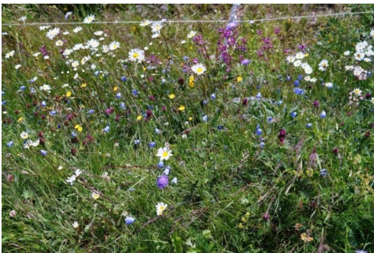
Figur 20. Prestekragar, blåkløkker og tjøreblom i ein vegkant i Svartdal. Desse tre kjende og kjære blomane er gode karakterartar for gamal slåttemarksflora.