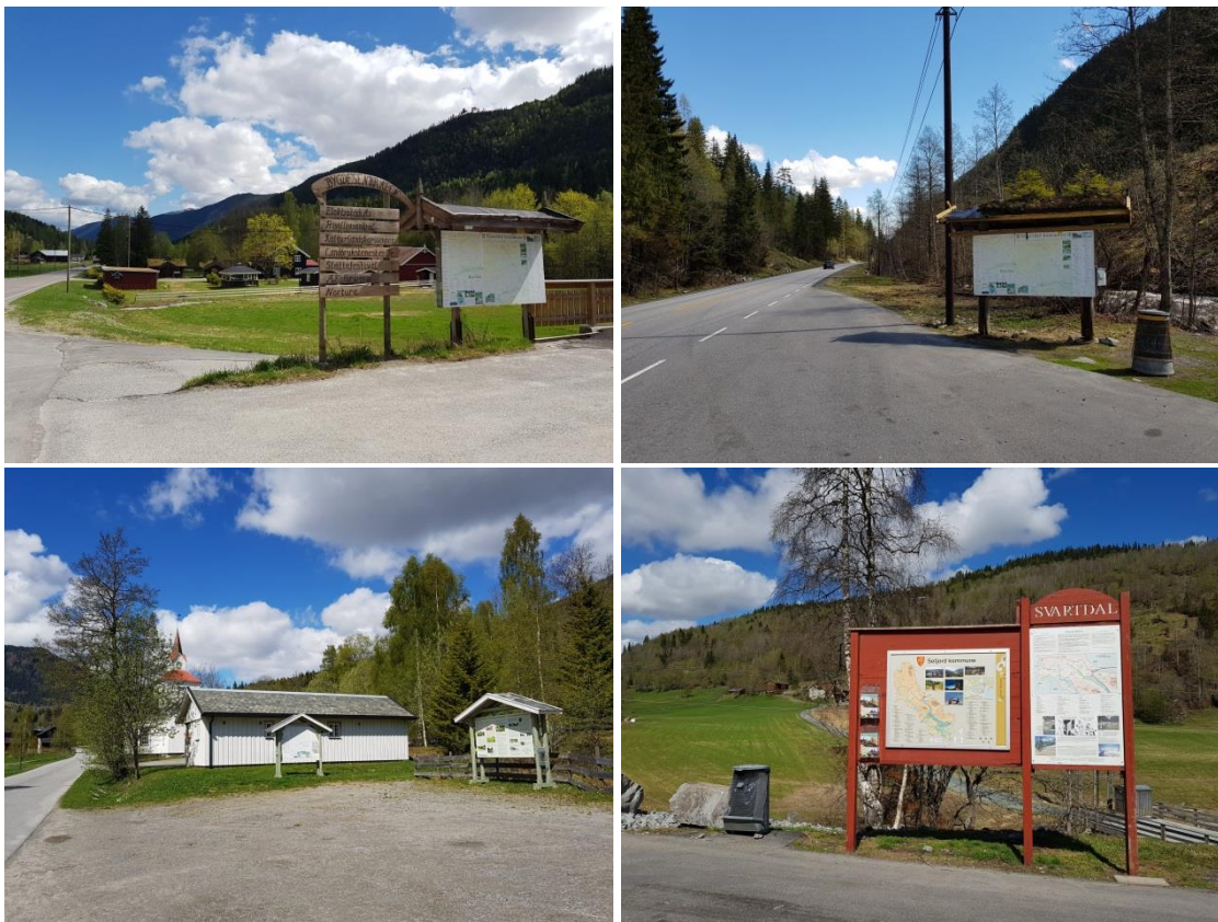
Figur 16. Turistinformasjonspunkt ved Bygdesentralen (oppe t.v.), i vestre del av Ambjørndalen (oppe t.h.), ved Hjartdal kyrkje (nede t.v.) og i Svartdal (nede t.v.). Ved Hjartdal kyrkje er det ei tavle med vanleg turistinformasjon og ei tavle med kulturlandskapstema.

Per 2018 er det tre tavler med turistinformasjon innanfor området, samt ei tematavle om kulturlandskap. Turistinformasjonstavlene er i varierende forfatning og treng ei oppdatering og ei samkøyring. UKL sin profilbank for skilt skal leggast til grunn med ein samkøyring av skilt i området.