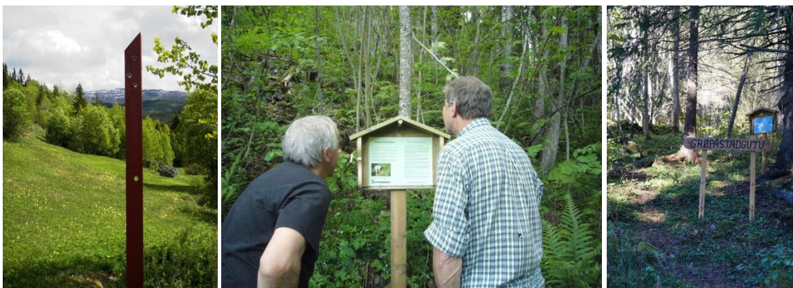
Figur 18. Glimt frå Gullstigen, Ambjørndalsstigen og Grøpåstadgut.