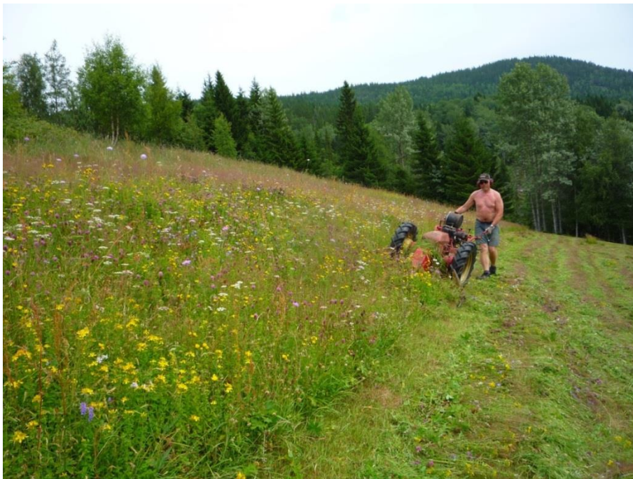
Figur 7. Slått av ekre (jorde lagt om til eng) på Sud-Århus i Hjartdal. Over tid har mange ekre utvikla dei same kvalitetane og artsrikdomen som dei «ekte» slåtteengene. Hovudelementa er inga gjødsling og sein slått. Håslått og/eller haustbeite er også positivt for å betre tilhøva for dei slåttemarkstilknytte artane.

Dei tradisjonelle slåtteengene er levande kulturminne, og viktige for opplevinga av bygdlandskapet vårt. Avkastinga er sjølv sagt lita i samanlikning med gjødsla og fulldyrka eng, sjølv om den næringsmessige kvaliteten er høg («medisinhøy»).