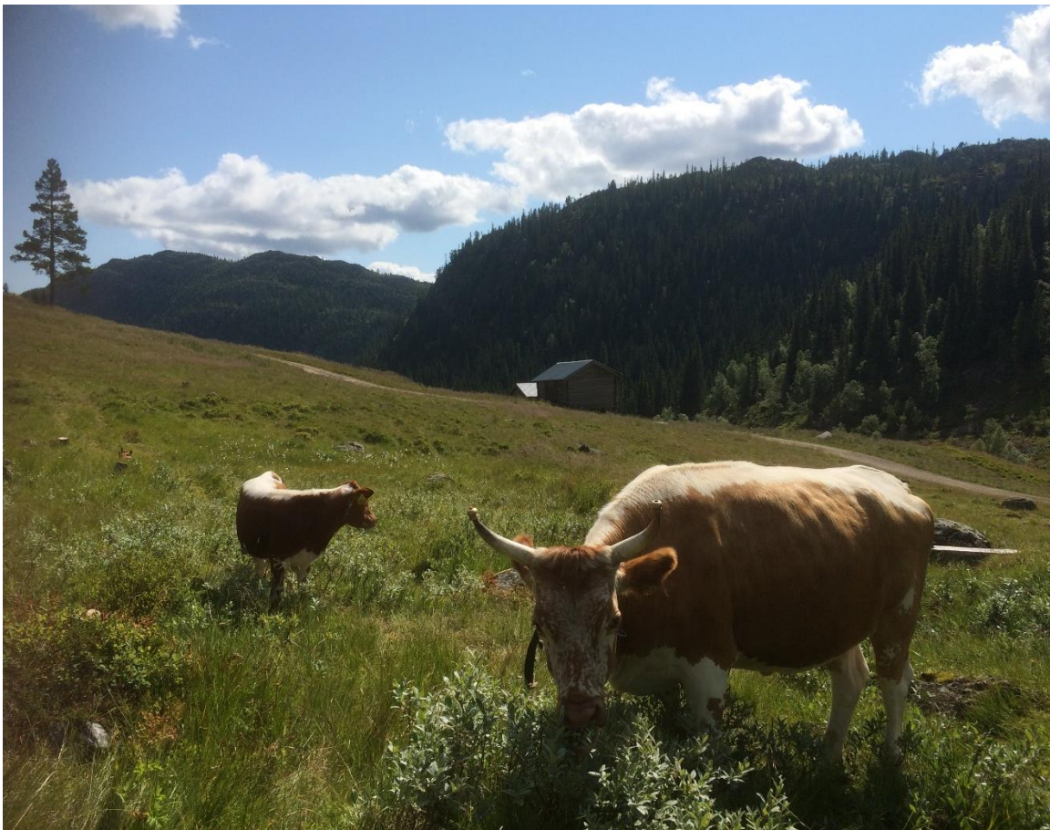
Figur 1: Telemarksfe på beite i Storstaul, Svartdal.