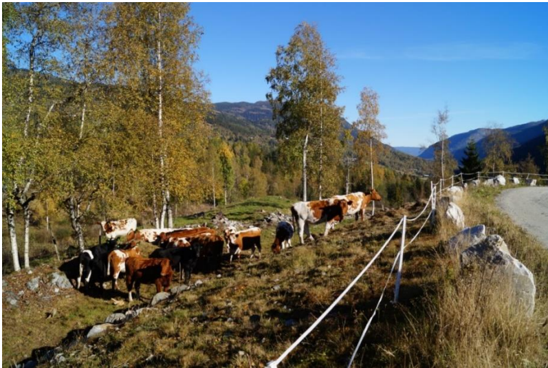
Figur 5. Kyr frå Teleros samdrift, Hjartdal. I samband med bygging av samdriftsfjøset blei det rydda fram att mykje gamalt beitelandskap i området. Området eignar seg godt for å ta i mot grupper, både med tanke på utsyn, møtelokale i fjøset og kombinasjonen av gamalt og nytt.