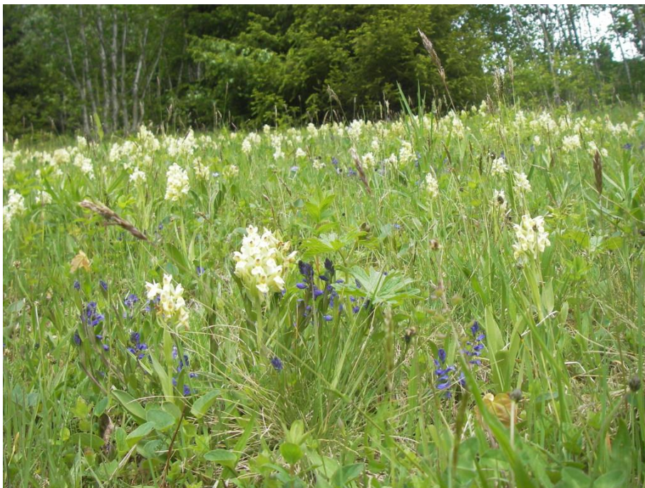
Figur 8. Vårflora med systemmarihand og blåfjør på slåttemark på Ambjørndalen i Hjordal. Dette er ein av mange lokalitetar med den slåttemarkstilknytte og raudlista orkideen systemmarihand i Hjordal og Svartdal UKL.

For artsmangfald knytt til slåtteenger er det elles ei stor føremon at det ligg fleire lokalitetar i nærleiken av kvarandre. Dette har med samspelet mellom plante- og insektliv og moglegheitene for krysspollinering å gjera. Denne typen «sune landskap» er viktige for ivaretaking av pollinerande insekt, og fungerer også som ein levande genbank for utvikling av landsortar. Ivaretaking av genetisk variasjon og lokale tilpassingar skjer best "in situ" (på staden), og er avhengig av rett skjøtsel. Dette er særleg viktig å ta vare på med tanke på klimaendringar. Slike område kan også huse større og meir robuste bestandar av spesielt krevjande og sjeldne artar.