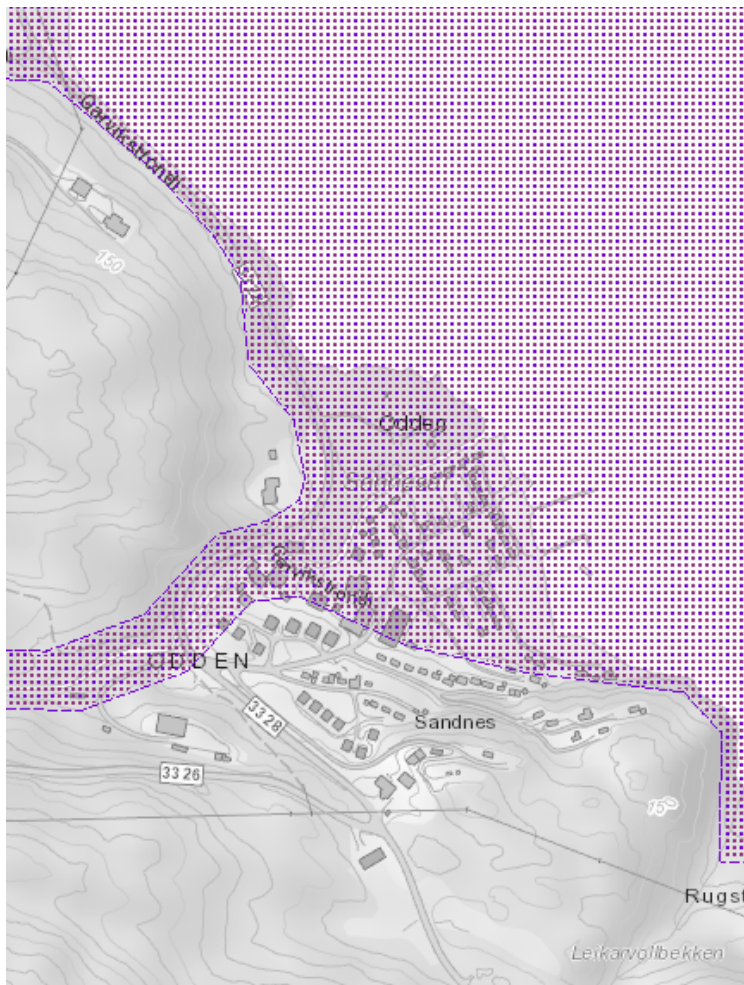
Kartutsnittet viser aktsomhetssone for flom (NVE Atlas)

Det er ikke gjennomført flomsonekartlegging for denne delen av Seljordsvatn eller Sannesåi, men området ligger innenfor aktsomhetssone for flom (NVE Atlas). Flomsituasjon må i planarbeidet vurderes opp mot planlagte tiltak.