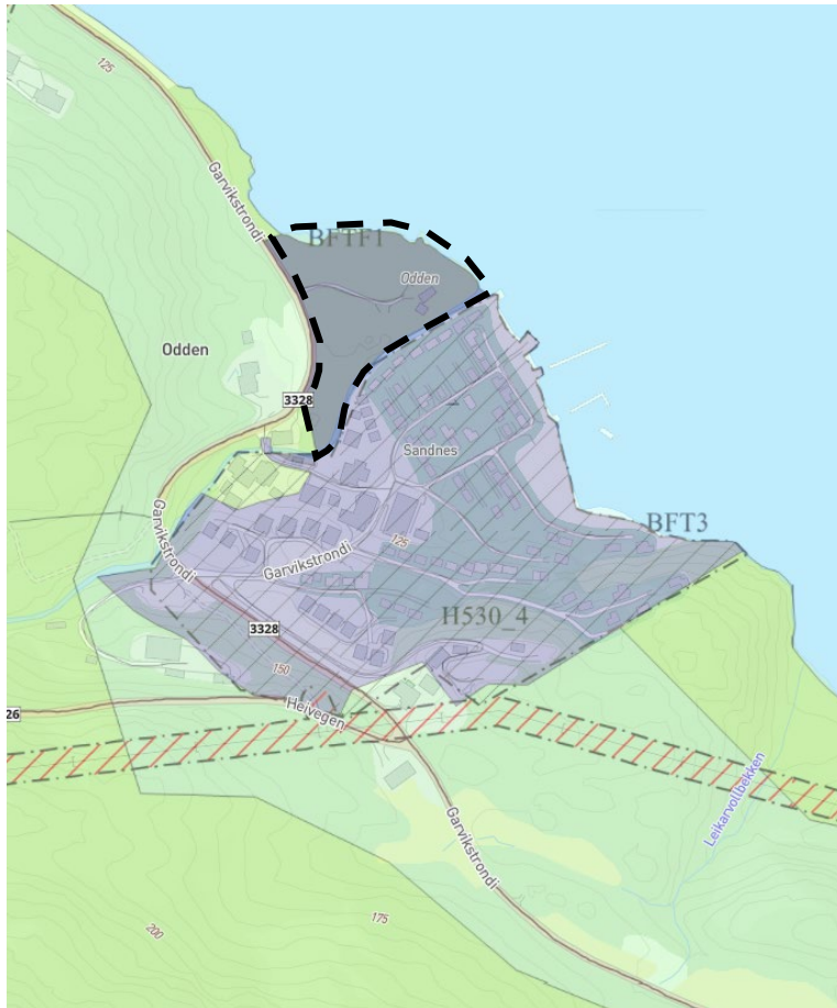
Kartutsnitt som viser utsnitt av kommuneplanens arealdel.