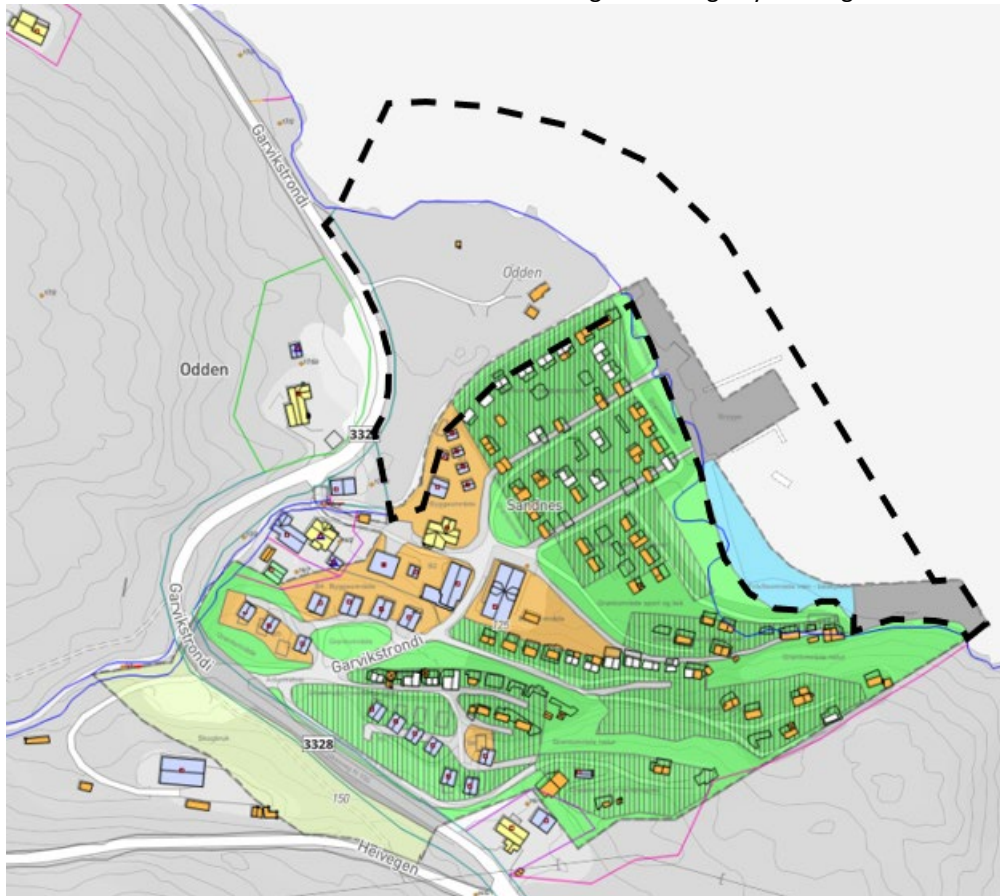
Kartutsnitt som viser foreslått plangrense (markert med svart stiptet linje)

Det påpekes at endelig planområdet kan bli mindre enn det som vises her, men siden detaljer ikke avklart i denne fasen tas det med et større areal enn nødvendig for å unngå ny varsling.