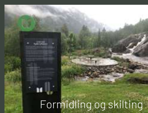
Formidling og skilting