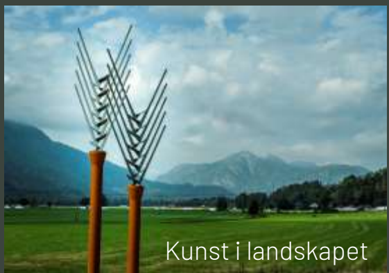
Kunst i landskapet