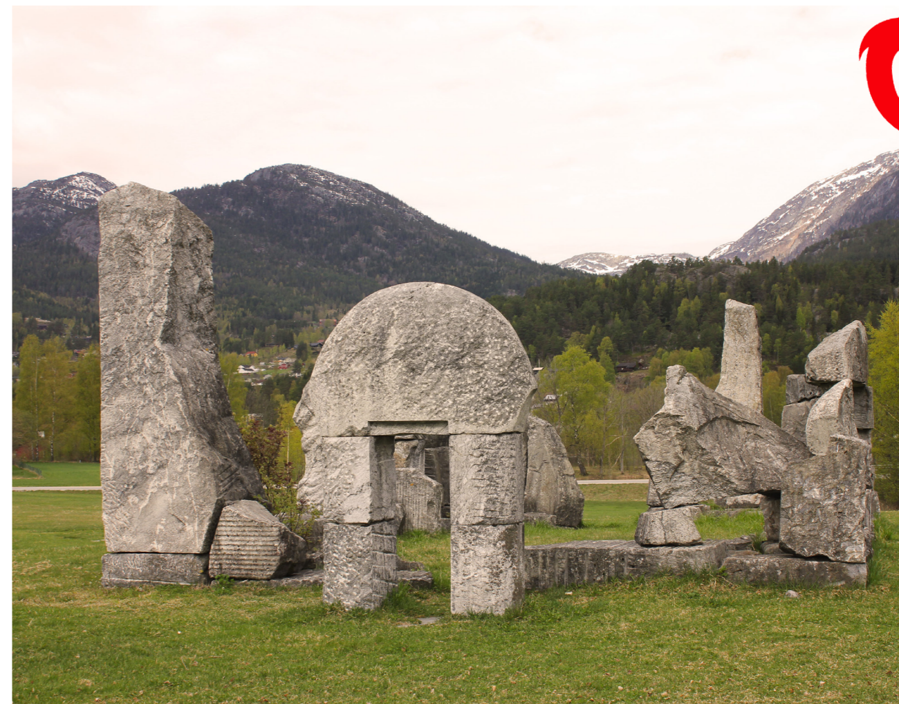
TUFT 13 NORDISKE BILETHOGGARAR

Dette er ein skulptur som skal utrykke den dugnadsånden som finnast i Seljord. Den har to delar, den raude sendaren som tar opp krafta frå bakken, og den blå mottakaren som står og mottar dugnadskrafta. Ein kan tenke seg at dette er ei kraft som går i bølgjer, den kjem upp av jordrda her i seljord, for så å gå ned igjen i bakken og bli sendt viare til ein anna stad.