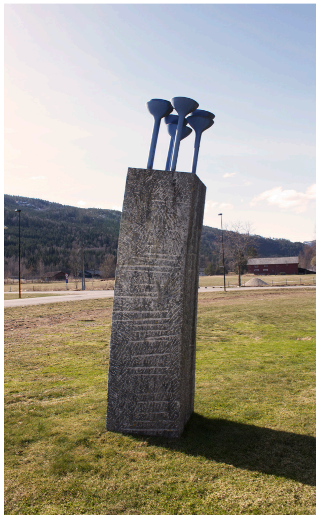
BØLGJE PHILLIP DOMMEN

Dette er ein skulptur som skal utrykke den dugnadsånden som finnast i Seljord. Den har to delar, den raude sendaren som tar opp krafta frå bakken, og den blå mottakaren som står og mottar dugnadskrafta. Ein kan tenke seg at dette er ei kraft som går i bølgjer, den kjem upp av jordrda her i seljord, for så å gå ned igjen i bakken og bli sendt viare til ein anna stad.