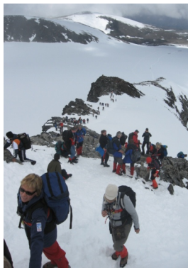
På veg opp dei spektakulære fjellformasjonane på Galdhøpeiggen i juni 2009.

universitet tek ofte sikte på å nå nivå 3, mens dei er på vaksenopplæringa. Etter det ligg utdanningslandet open for dei. To år er normert tid hos oss.