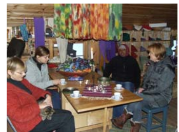
På Telespinn i Svartdal passar dei på skape kos i produksjonen, dame- og pusen.