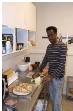
Anbes likar at det skjer noko. Utan gjester i kafeen blir det kjedeleg

Sjøormen Kro, der nye oppgåver ventar (resultat av jobb-messa).