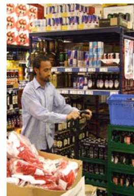
Arbeidsoppgåvene er mange i ein butikk. Alt det andre rundt det norske arbeidslivet i ein butikk, kan overførast til andre arbeidsplassar