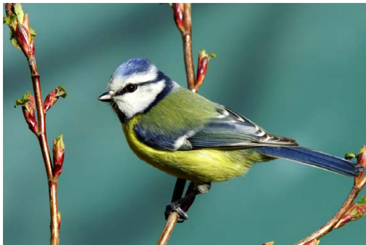
Ein liten sangfugl

Fordi det ble rytme, kom sangen igjen. Fordi det ble sang, kom varmen igjen. Fordi det ble varme, kom leken igjen. Fordi det ble lek, kom latter igjen. Fordi det ble latter, kom barnet igjen. Fordi det ble barn, kom veksten igjen. Fordi det ble vekst, kom landet igjen. Rytme var grunnen til alt.